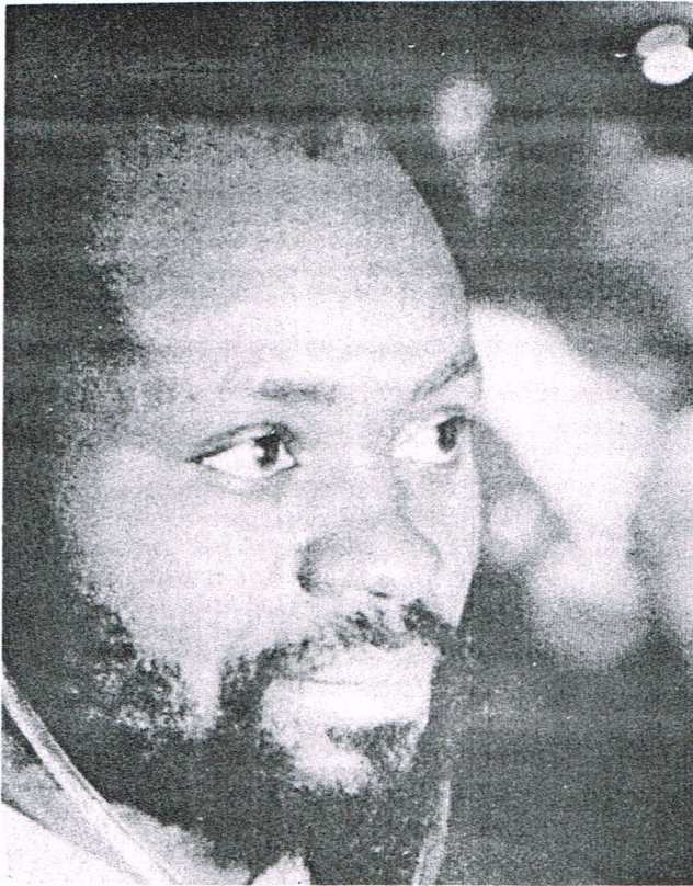
EL PRESIDENTE SAMORA MACHEL

Durante el verano, Africa ha visto surgir en su seno, tres nuevos estados independientes; tres nuevas Republicas cuya accesion a la Independencia, tenemos hoy el gusto de saludar: La Republica del Cabo Verde, que dirigida por el PAIGC, como Guinea Bisau, sera probablemente llamada a ferarse con la Republica del continente. La situacion originada por la creacion del nuevo Estado, constituye, sin duda, un caso unico en el mundo: es la primera vez, en la historia de las naciones que dos Estados independientes y soberanos de Africa son dirigidos por una